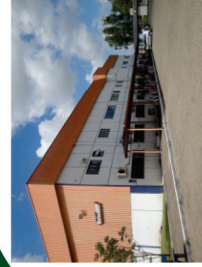
Sede da empresa na cidade de Canoas

Rua Berto Círio, 1488 / CEP 92.420-030 / Canoas / RS / Brasil Fone: 51 3052.9800 / Fax: 0800.51.7457 e-mail: raisman@raisman.com.br